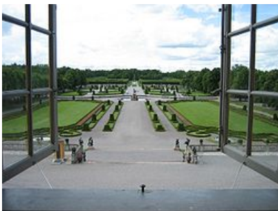
Vista del xardín barrocu, dende'l palaciu.

En 1661 el palaciu pasó a manes de la reina Eduviges Leonor , y amburóse el 30 d'avientu del mesmu añu. La reina entós encargó la so reconstrucción al arquitectu Nicodemus Tessin el Viejo , quien nun pudo concluyir la obra, dexándola al so fíu Nicodemus Tessin el Mozu. Eduviges Leonor tomaba parte nel gobiernu de la rexencia del reinu por causa de la minoría d'edá del so fíu Carlos XI y entamó un edificiu campanudu acorde col papel de gran potencia qu'adquiriera Suecia n'Europa tres la Paz de Westfalia. La obra de los Tessin taba influyida principalmente pol neoclasicismu de Francia y los Países Baxos .